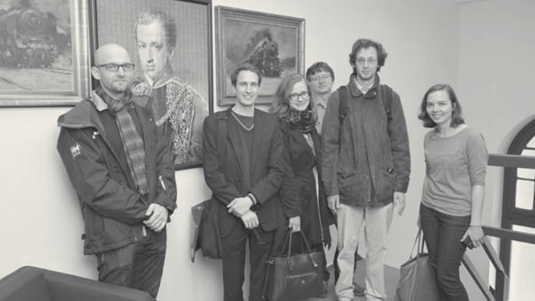
PROHLÍDKA MASARYKOVA SALÓNKU NA MASARYKOVĚ NÁDRAŽÍ V PRAZE JAKO SOUČÁST ROZLUČKY S LETNÍM SEMESTREM 2015.