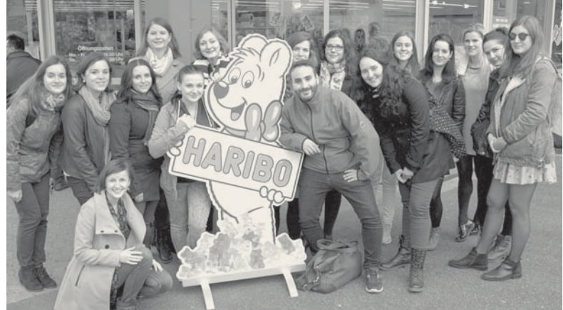
EXKURZE DO BONNU A KOLÍNA